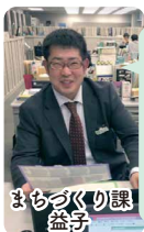
まちづくり課 益子

認知度ゼロの那須烏山市★「山あげ祭」等、トップレベルの観光資源と、トップレベルの下手くそプロモーション…今後、市は観光振興を強烈に改革していきます。一緒に、観光革命しませんか?