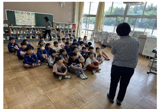
〈写真：図書ボランティア「かたつむりの会」による読み聞かせ〉

また、かたつむりの会による読み聞かせ活動なども行うことができ子どもたちは読み聞かせを楽しんで聞くことができました。