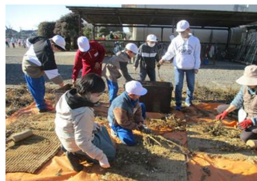
〈写真：食育菜園ボランティアの皆さんと一緒に大豆の収穫を行っている様子(R7. 12. 10)〉