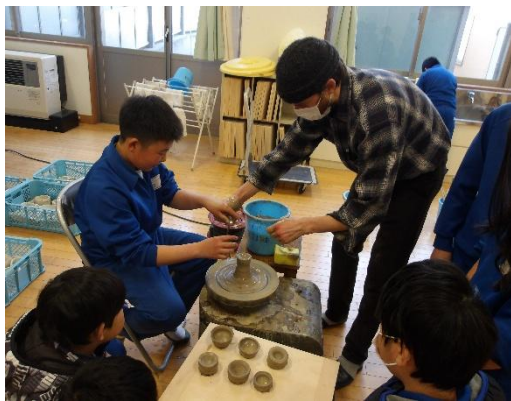
〈写真：益子焼体験活動〉