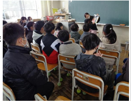
〈写真：児童への読み聞かせの様子〉

「図書館ボランティア」も、月1回本校図書室に集まり、図書館司書とともに2時間程度図書室の環境整備に取り組み、子どもたちの本とのふれ合いを支援しています。