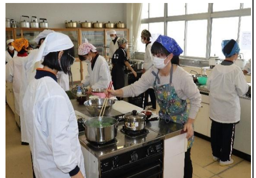
〈写真:学校支援ボランティア活動の様子〉

本校では、一昨年度の環境整備ボランティアに加え、調理実習・裁縫実習・読み聞かせのボランティアを実施しました。募集は保護者や祖父母への通知だけでなく地域回覧を活用して、地域の方々にも広く募集しています。昨年度は環境整備に10名、調理実習に9名、裁縫実習に3名、読み聞かせに1名の登録があり、とても充実した活動となりました。また、年度末には学校支援ボランティア懇談会(茶話会)を開催し、お茶を飲みながら、学校と地域がつながり、さらによい活動にするにはどんな工夫が必要か話し合いました。今年度もさらに充実した活動にしていきたいと考えていますので、皆様のご協力をよろしくお願いいたします。