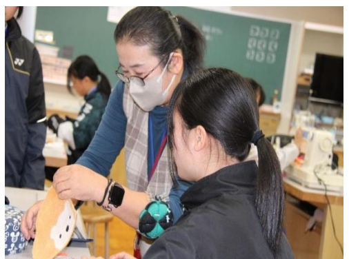
〈写真:ミシンボランティアの様子〉

本校の活動では、環境整備、家庭科授業、読書活動の各分野で多大なるご協力をいただきました。毛虫駆除など、専門的な作業にもご協力いただき、生徒たちが安心して屋外活動に打ち込める環境が整いました。ミシンボランティアでは、「古着のリメイク」にも挑戦し、着なくなった衣類から鞆やポーチを製作する活動を行いました。ボランティアの方に、布の裁断や仕上がりを綺麗にするコツを教わりながら、生徒たちは思い思いに形にする楽しさを実感し、ものづくりの喜びと資源を大切にすることを育む貴重な機会となりました。図書室では、季節の移ろいを感じさせる華やかな掲示物を作成していただきました。その温かい空間づくりのおかげで、生徒たちが自然と本を手に取り、読書に親しむ時間が増えております。