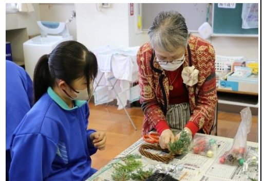
〈写真:アドバイスを受ける様子〉