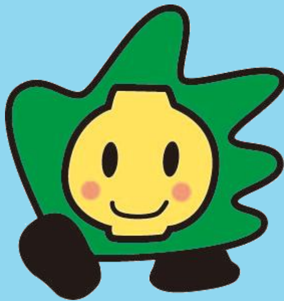
益子町キャラクター「マシコット」

発行: 益子町生涯学習推進本部 (益子町教育委員会 生涯学習課) 住所: 益子町大字益子3667-3 中央公民館内 電話: 0285-72-3101 FAX: 0285-72-3110 E-mail: syougai@town.mashiko.lg.jp ホームページ: http://www.town.mashiko.tochigi.jp/