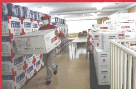
今治市林野火災 支部倉庫から救援物資を出している様子