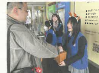
▲街頭募金を行う青少年赤十字メンバー 宇都宮市