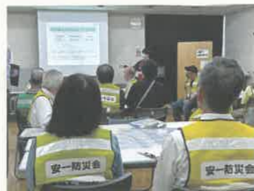
▲自治会員対象に実施した防災セミナーの様子・壬生町

地域の自助や共助の力を高め、災害から住民を守る知識を伝える「防災セミナー」を実施しています。