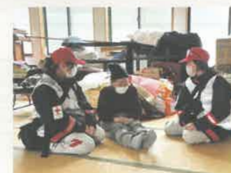
▲避難所内でのこころのケアの様子・石川県珠洲市