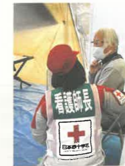
▲救護所内での診療の様子 石川県珠洲市