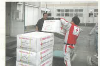
▲令和元年東日本台風・小山市