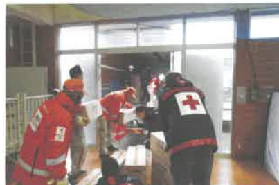
▲救援物資搬送を行う日赤スタッフ 岩手県大船渡市