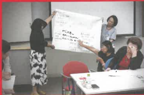
奉仕団会議 自団の活動状況を報告する奉仕団員