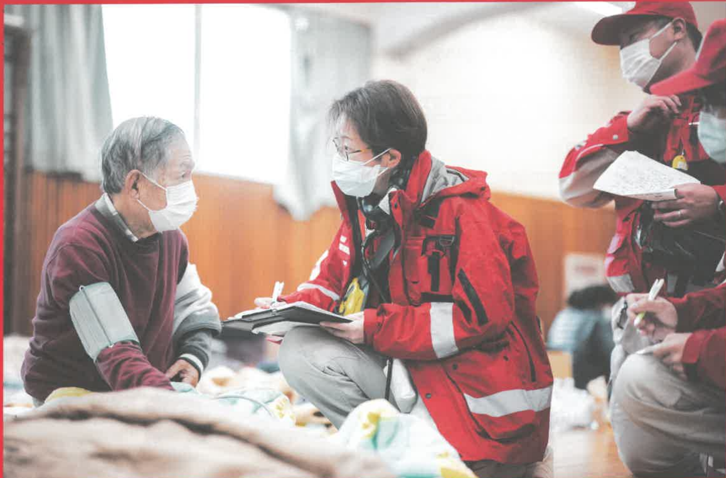
令和6年能登半島地震 石川県輪島市の避難所の巡回診療

地震や頻発する大雨災害、日常に潜む病気や怪我、世界各地の人道危機。 助けあうことで救える人々があります。「救う」活動を続けるため、 どうか、赤十字活動資金への温かいご協力をお願いいたします。