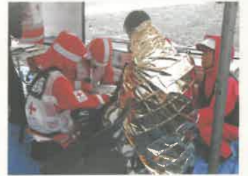
▲出水期に向けた訓練の様子・宇都宮市

被災地で迅速な医療救護活動を展開するため、様々な想定をし、関係機関と連携しながら訓練を実施しています。