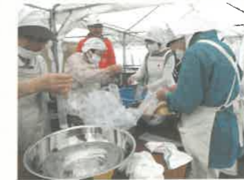
▲非常食炊き出し研修の様子・宇都宮市