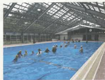
▲水上安全法講習・那須町

救命手当や応急手当を学ぶ「救急法」「幼児安全法」「水上安全法」、健康や介護を学ぶ「健康生活支援講習」を実施しています。