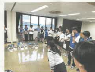
▲国際人道法を学ぶ青少年赤十字メンバー・宇都宮市