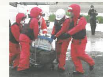
▲医療救護訓練に参加する防災ボランティア・宇都宮市

赤十字ボランティアによる炊き出しや地域のボランティアセンターの支援などを行います。