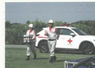
▲血液製剤供給訓練の様子・宇都宮市

災害時、全国的な血液製剤の需給調整機能を活用して、被災地において必要な血液製剤の確保に努めます。