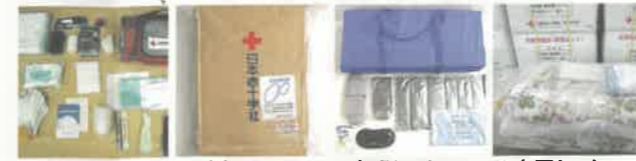
▲緊急セット ▲毛布 ▲安眠セット ▲布団セット

救護員やボランティアに対する研修と訓練、救護活動用資材や救援物資を整備しています。