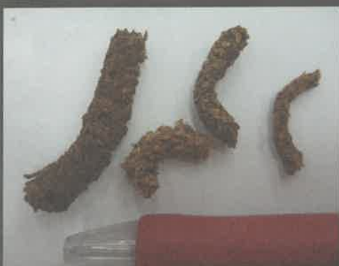
木くずと幼虫の糞が固まっ かりんとう状となる