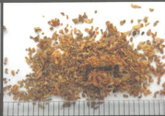
フラスの内容物にはノミで削ったような 薄い木くず片が含まれている