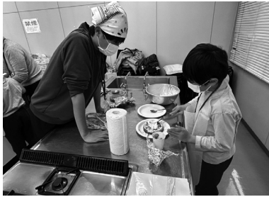
「英語でクリスマスパーティー」