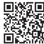
益子町指定工事店