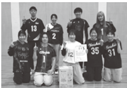
ボス猫のみなさん▶