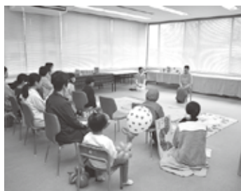
「読み聞かせ・すばなし」