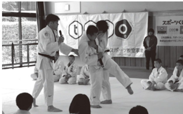
柔道教室のようす