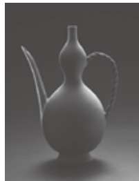
戸田浩二 《焼締儂水揺》 2025年