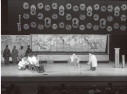
綱神社太々神楽の様子

平成29年度から継続してきた植樹体験は、今回で6回目となり、これまで300名以上の児童が参加し、植えた苗木は500本を超えました。