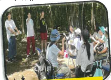
トライやるスクール ボランティア