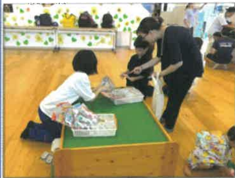
ましこっこ夏まつり