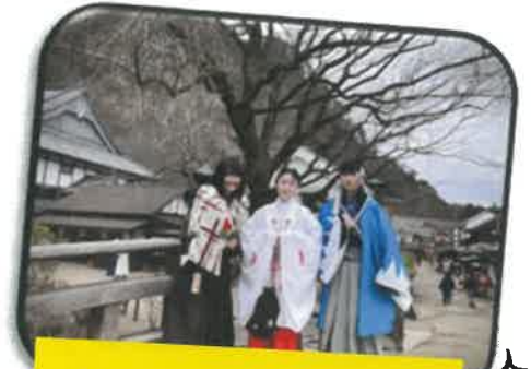
最後はみんなで研修旅行！