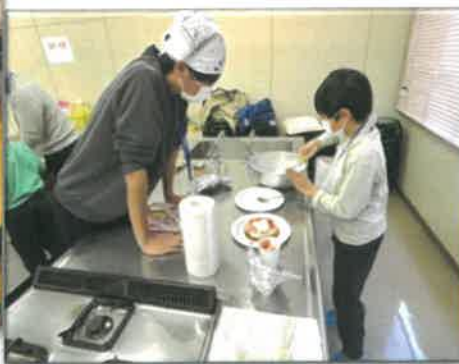
いきいきトライやるスクール