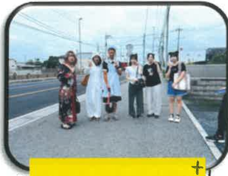
他市町へ出張ボランティア