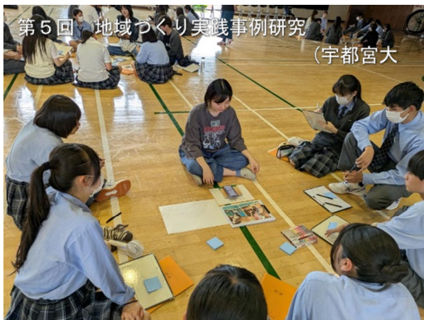
第5回 地域づくり実践事例研究 (宇都宮大)