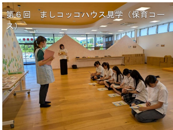
第6回 ましコココハウス見学 (保育コース)