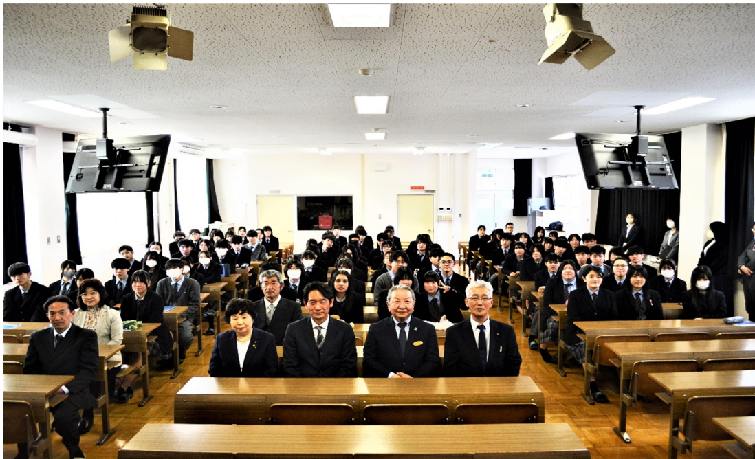
令和7年4月16日(水) 開講式 2年次の皆さんとましこ未来大学関係者