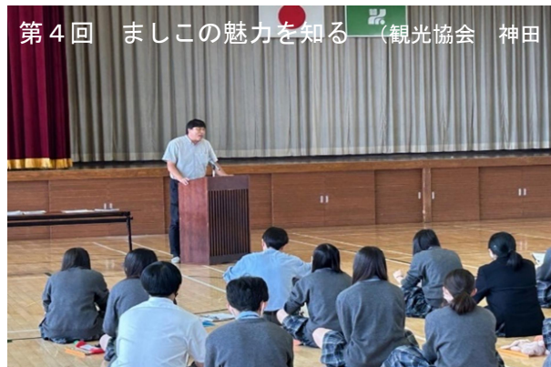
第4回 ましこの魅力を知る (観光協会 神田)