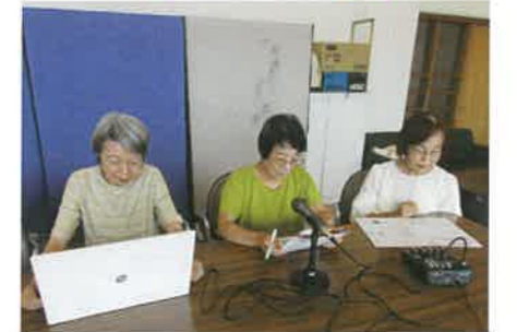
音訳ボランティア「うぐいすの会」 広報ましこを録音している様子 ボランティアを募集しています!!