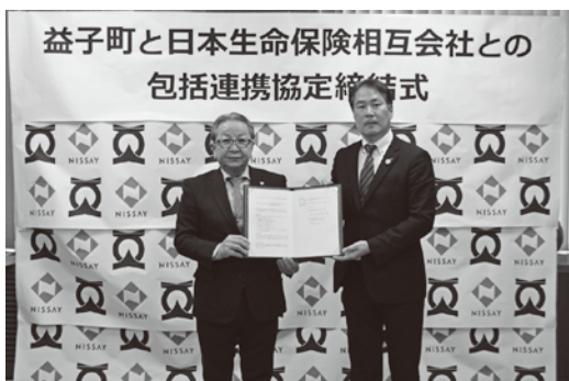
(左から) 広田町長、北村宇都宮支社長

また、小学校新3年生全員に社会科学習資料「とちぎの農業」、新5年生全員に補助教材「農業とわたしたちの暮らし」も寄贈していただきました。今後の社会科や総合的な学習の時間の授業で、農業に対する理解を深めるために活用させていただきます。