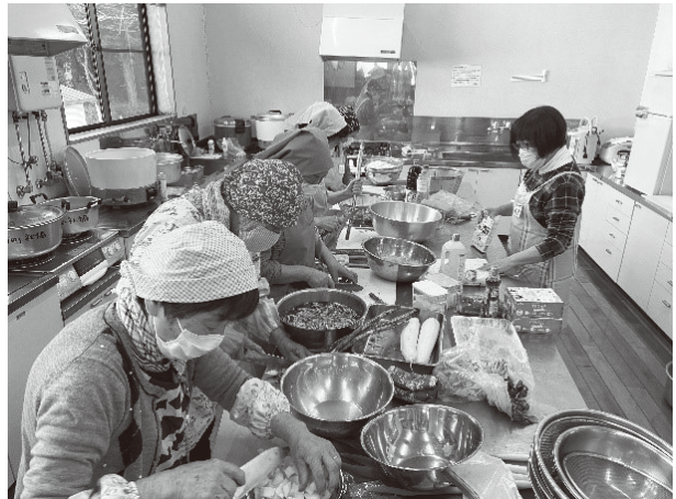
提供された食材を調理するスタッフのようす