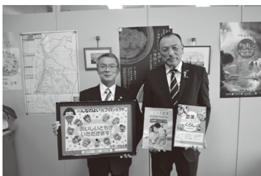
(左から) 三田教育長、国府田代表理事組合長

「とろたまぷりん」は、益子町塙の薄羽養鶏場さんの新鮮なたまごを使った道の駅の人気商品です。