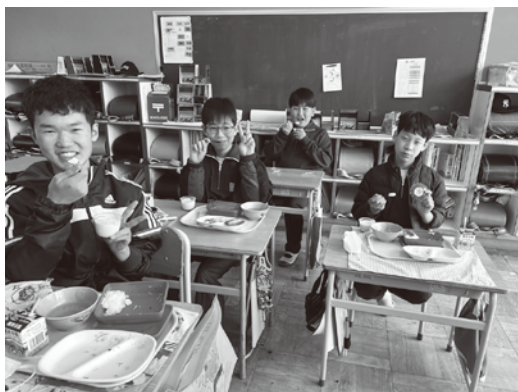
とろたまぷりんを食べる益子西小の児童たち