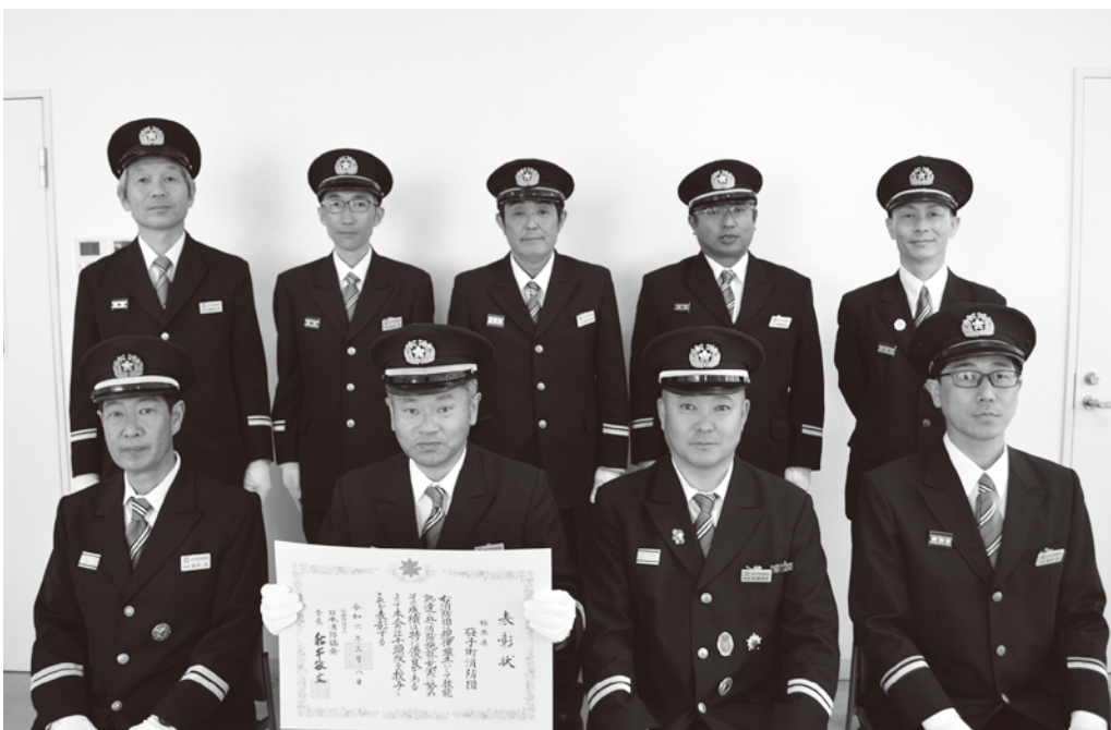
竿頭綬を受章した町消防団

竿頭綬とは、消防団活動の功労や功績に対しその榮譽をたたえるため団旗の先端につける綬(リボン)のことです。