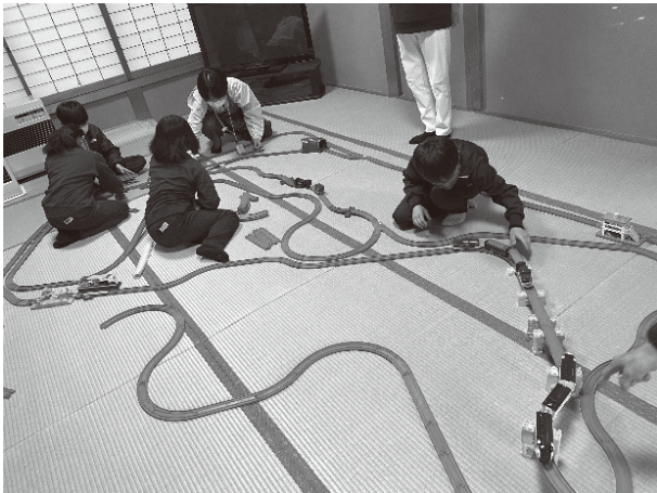
プラレールで遊ぶ児童のようす

皆さまの地区で開催の際は、ご協力をお願いします。次回は5月に埴公民館にて開催予定です。