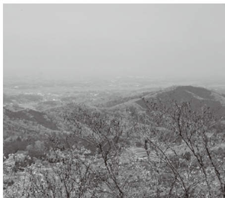
雨巻山々頂から益子町を望む

【春】5月 冬の間、すべての葉を落としていた落葉樹が一斉に葉をつけ始め、緑まぶしい季節になりました。益子町では「春の陶器市」も行われ、たくさんのお客で町中が賑やかになります。また、町内には栃木百名山にも選ばれた山が2つあり、人気のハイキングコースになっています。 1つ目は「雨巻山」です。芳賀郡最高峰の名山ですが、標高533メートルと低山であり、初心者にも人気です。まして世間遺産にも認定されており、山頂から益子町を一望できます。