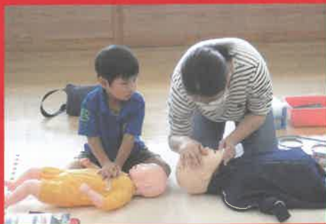
赤十字幼児安全法講習(さくら市)