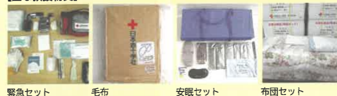
緊急セット 毛布 安眠セット 布団セット

救護員やボランティアに対する研修と訓練、救護活動用の資材や救援物資を整備しています。