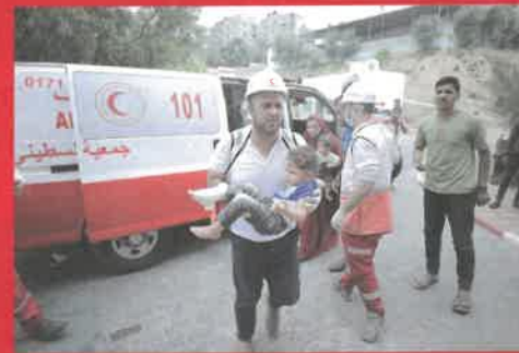
ガザ 負傷者の搬送