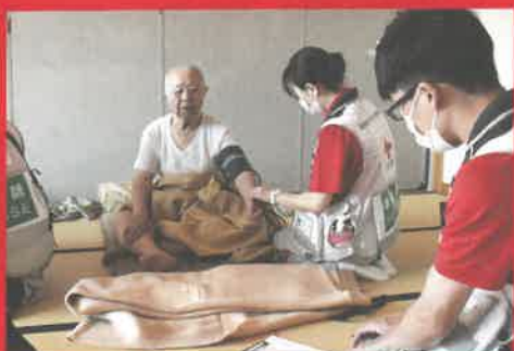
医療チームの活動(令和5年7月大雨災害)

令和6年能登半島地震(巡回診療に向かう救護員)