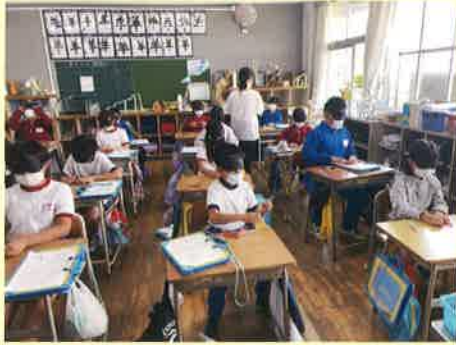
視覚障害体験（七井小） ～アイマスクをして折り紙を折っている様子～

6月20日に七井小学校、7月11日には田野小学校を訪問し、福祉体験学習を実施しました。福祉を身近に感じてもらうきっかけとして車いす体験とアイマスクを利用した視覚障害体験を体験していただきました。