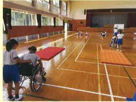
車いす体験（田野小）