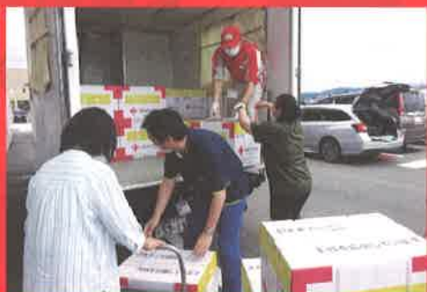
令和4年8月大雨災害の救護活動(山形県)