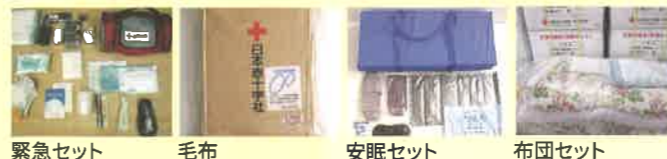
緊急セット 毛布 安眠セット 布団セット