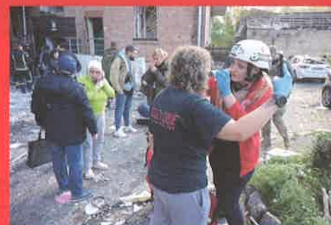
ウクライナ人道危機に対する救援活動