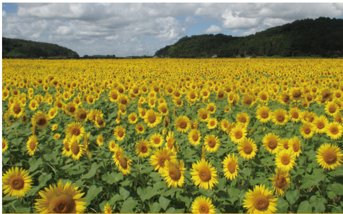
ひまわり (約5ha/ 上山会場)