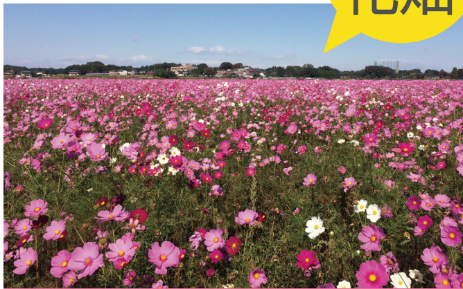
コスモス (約5ha/ 生田目会場)