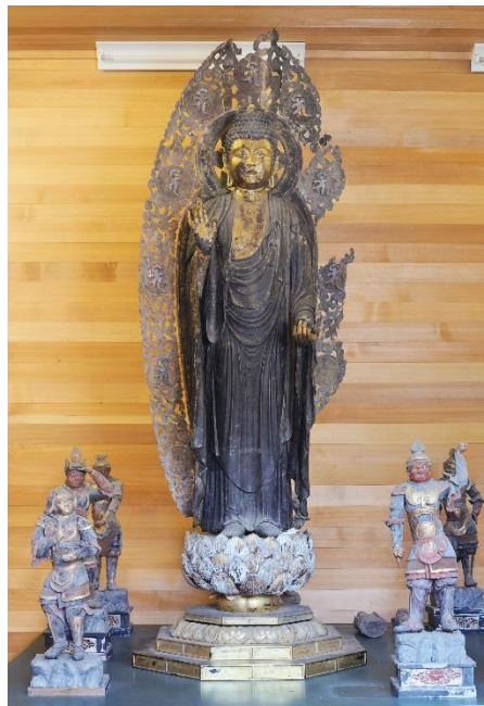
11. 木造薬師如来立像