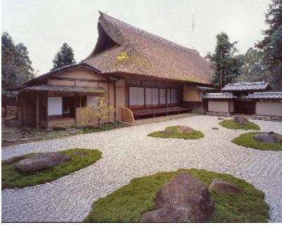
3 4. 春風萬里莊