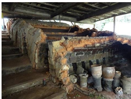
15. 笠間焼発祥に係わる登窯