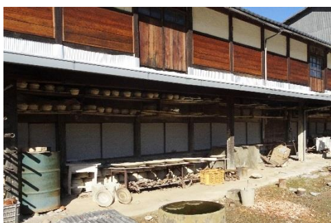
19. 根古屋窯 (旧益子陶器伝習所)