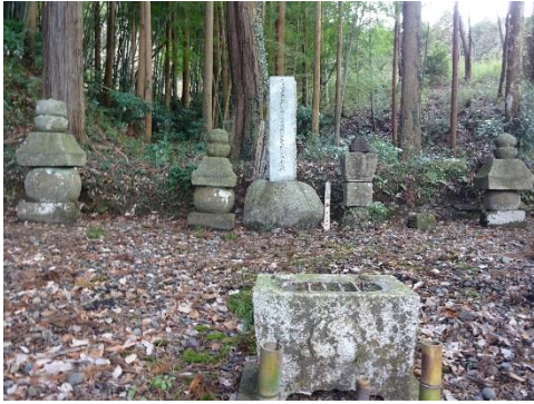
8. 笠間氏累代の墓地