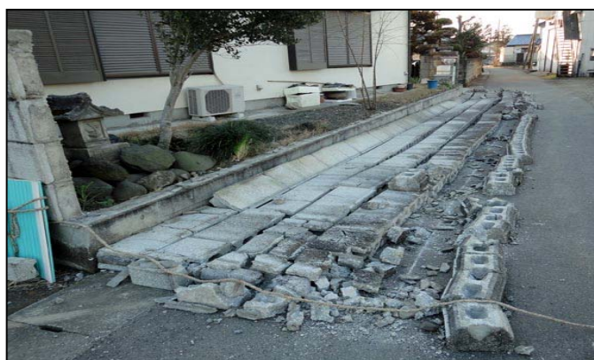
ブロック塀の倒壊